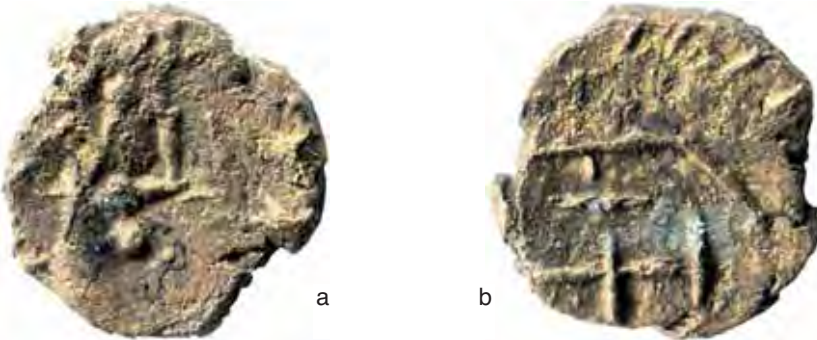
Fig. 2 a-b – Nummo dal Ripostiglio di Brescello, coni B-D' (diam. mm. 9; Museo civico Biassono).