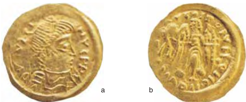
Fig. 5 a-b – Tremisse pseudoimperiale cd. di imitazione. Da Ripostiglio di Aldrans (diam. mm. 18; da Hahn-Luegmeyer).