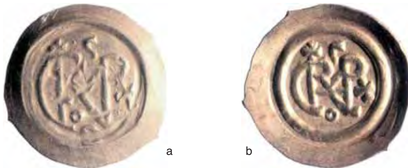
Fig. 15 a-b – Tremisse a doppio monogramma. Da Brescia, Santa Giulia (diam. mm. 19; Musei civici Brescia).