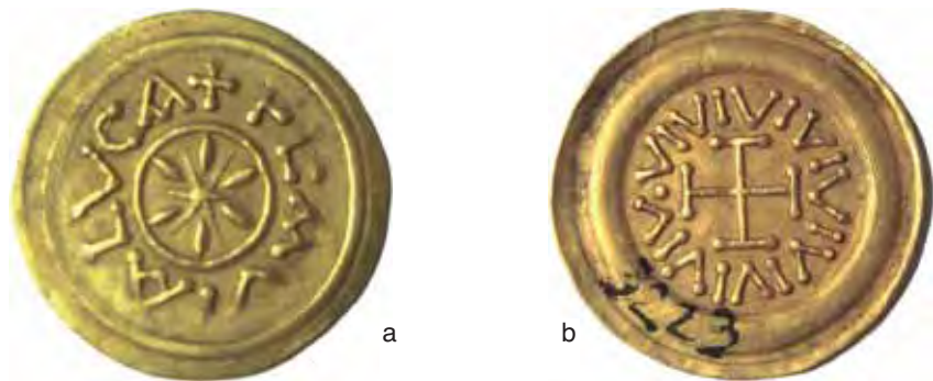
Fig. 12 a-b – Tremisse di Lucca (diam. mm. 18; da Luni, inv. n.3223).