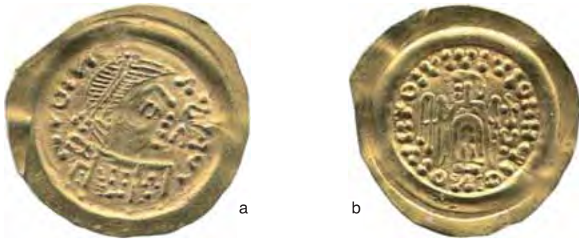
Fig. 16 a-b – Tremisse con marinusmon (diam. mm. 18,5; Gab. num. Milano; M.0.9.4377-22-D).