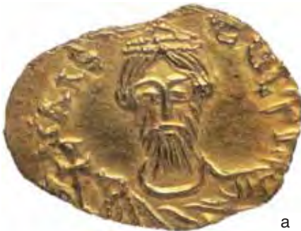
Fig. 20 a-b – Tremisse Stellato di Desiderio per Sibirium (diam. mm. 18; Gab. num. Milano; M.O.9.4418-63-D).