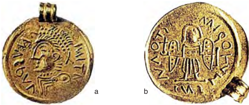
Fig. 1 a-b – Tremisse pseudoimperiale cd. pannonico. Da Cividale (diam. mm. 18,5; Museo naz. Cividale).