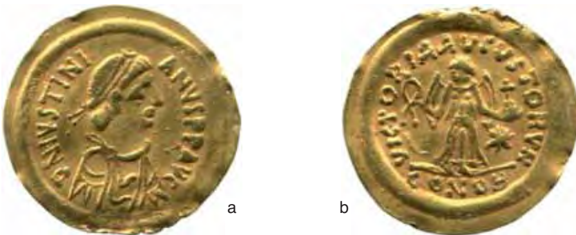
Fig. 3 a-b – Tremisse per Giustiniano I (diam. mm. 18,5; Gab. num. Milano, M.0.9.18345).