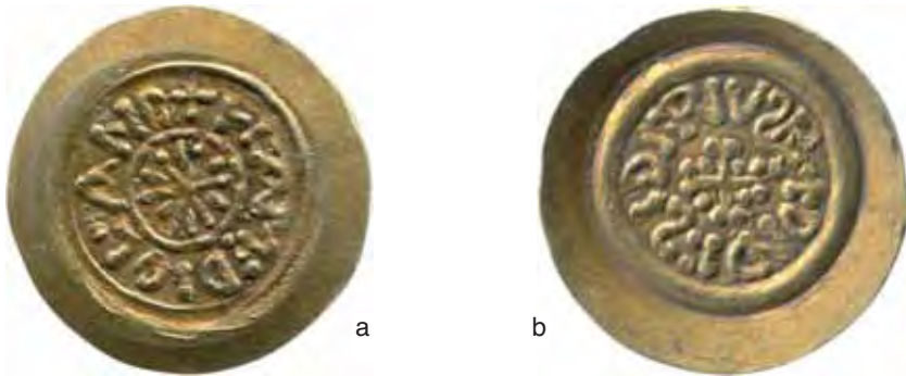
Fig. 14 a-b – Tremisse di Mediolanum per Desiderio (diam. mm. 18; Gab. num. Milano; M.O.9.4424).