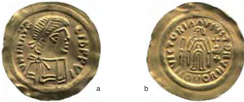
Fig. 7 a-b – Tremisse per Maurizio Tiberio, Tipo I (diam. mm. 18; Gab. num. Milano; M.0.9.4436).