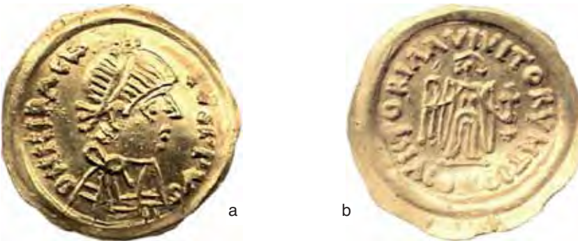
Fig. 9 a-b – Tremisse pseudoimperiale per Eraclio (da Riva TN; diam. mm. 18).