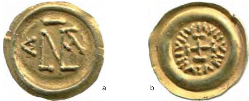
Fig. 11 a-b – Tremisse con monogramma di Lucca (diam. mm. 18; Gab. num. Milano; M.0.9.4439).