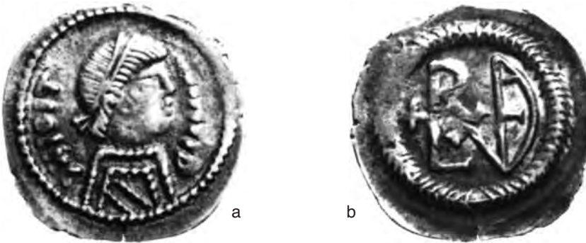
Fig. 8 a-b – Frazione di Siliqua pseudoimperiale, forse di Adalwald (Cambridge Fitzw; M.; da MEC I; diam. mm. 12).