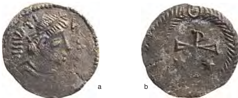
Fig. 6 a-b – Ottavo di Siliqua pseudoimperiale di imitazione. Da scavi Capitolium di Brescia (diam. mm. 11).