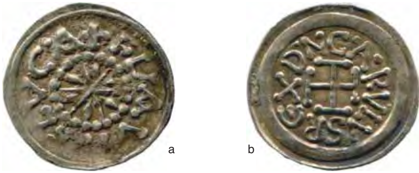
Fig. 22 a-b – Tremisse Stellato di Carlo per Lucca (diam. mm. 18; dalla Confessione di S. Pietro-BAV).