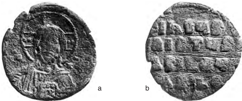
Fig. 24 a-b – Follis anonimo di Cl.A1 (diam. mm. 22; Padova, Museo Bottacin).