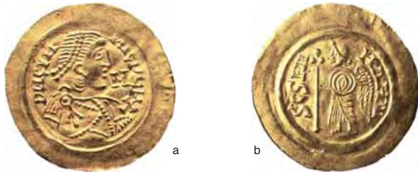
Fig. 17 a-b – Tremisse di Cunincpert (diam. mm. 20; Gab. num. Milano).