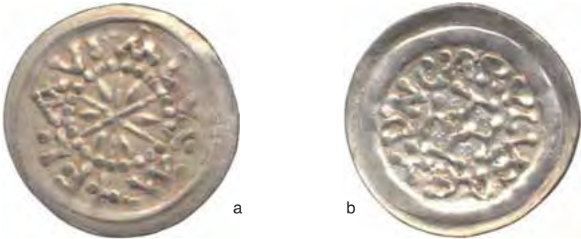
Fig. 23 a-b – Tremisse Stellato di Carlo per Lucca (diam. mm. 18; da Sari d'Orcinu-Punta San Damiano).