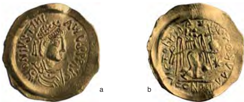
Fig. 4 a-b – Tremisse pseudoimperiale cd. di imitazione (San Mauro, tomba 27; diam. mm. 18,5; Museo naz. Cividale).