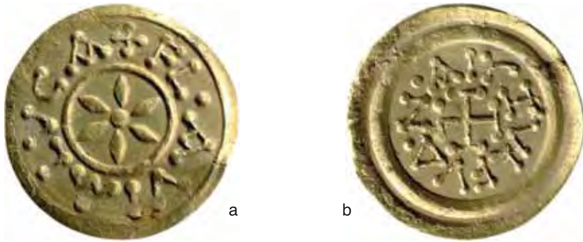
Fig. 13 a-b – Tremisse di Lucca per Aistulf (diam. mm. 18; Gab. num. Milano; M.O.9.4440-D).